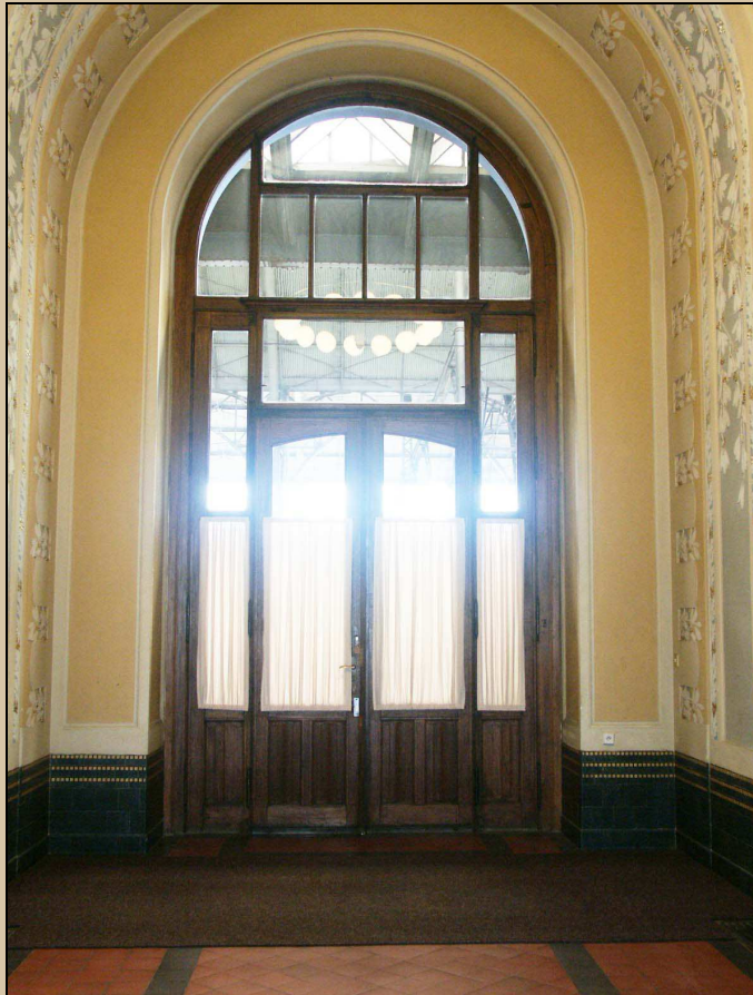
pohled z interiéru