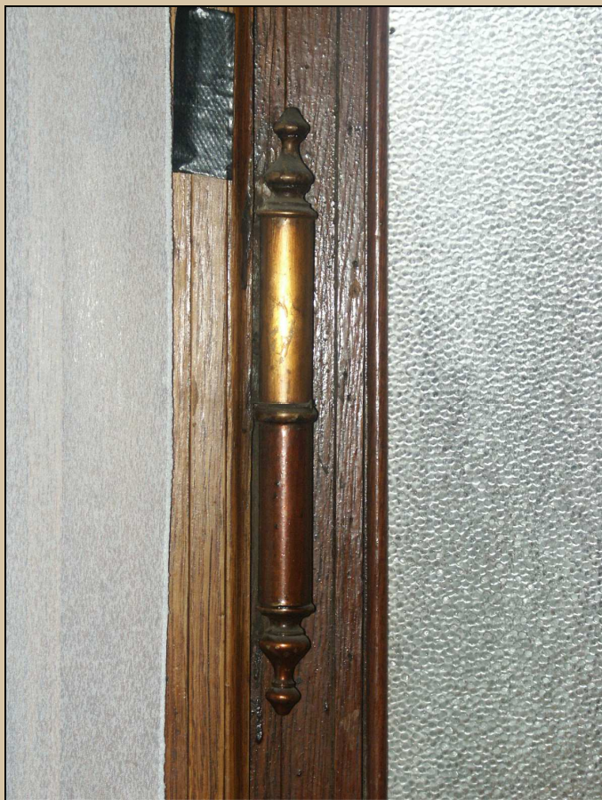
původní dvevní závěs na většině dvevních křídel