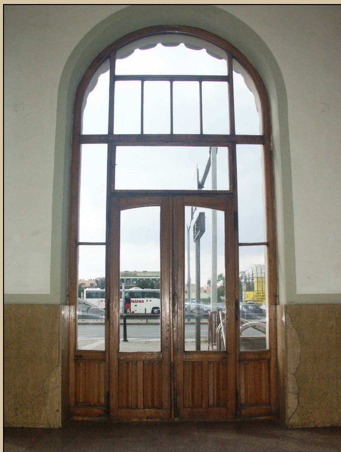
vnitřní líc dvevního křídla